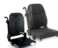
Rücken: ARJ 2172 bzw. 2173